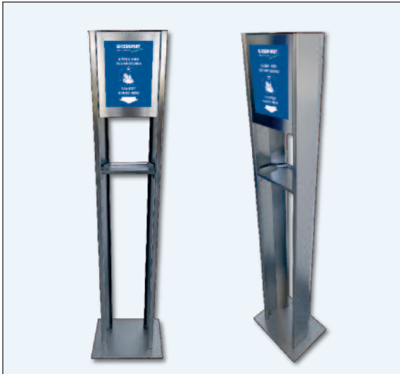
DESICARE MOTION Desinfektionstower aus V2A-Edelstahl