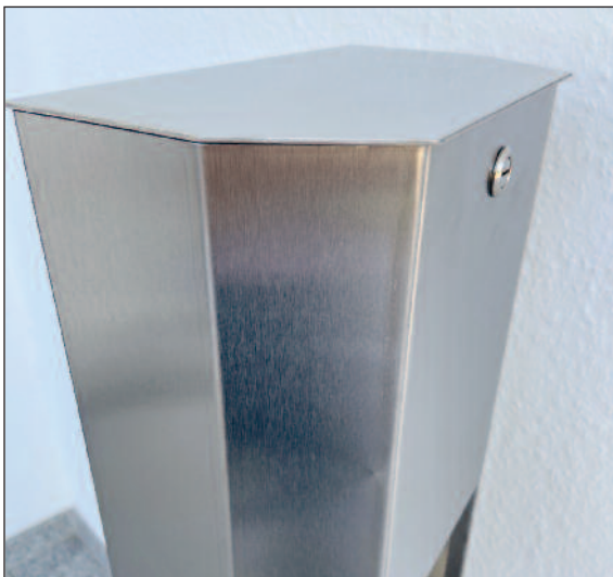
Aufklappbarer Deckel mit Sicherheitsschloss zum Nachfüllen des Desinfektionsmittels