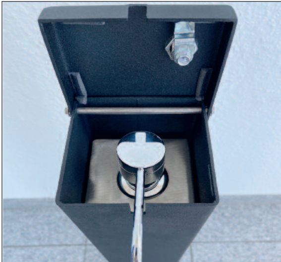
DESICARE SWITCH Desinfektionstower, schwarz, mit aufklappbarem Deckel zum Nachfüllen des Desinfektionsmittels in den Desinfektionsmittelbehälter