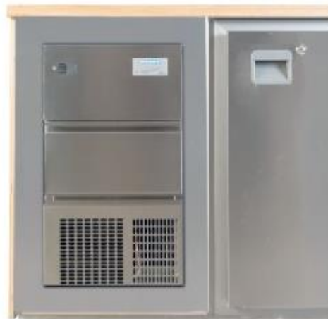
Thekeneinbau Modell W 25 LE / Luftgekühlt, Kältemittel R 290