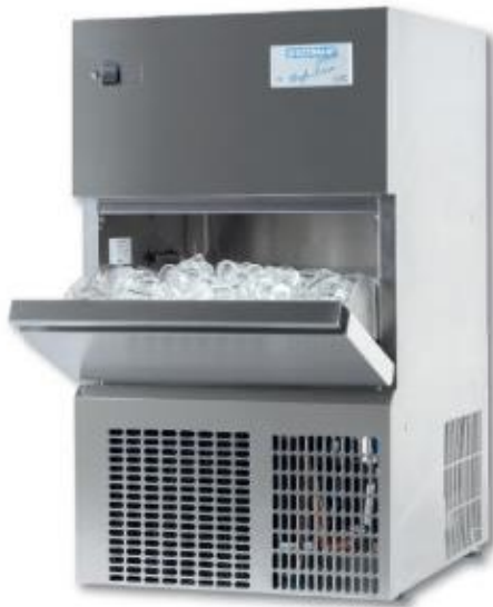
Modell W 25 LE / Table-Top Luftgekühlt, Kältemittel R 290

Ein echtes Geschenk an die Umwelt ist die neue Produktlinie High-Line . Besonders kompakt, komplett aus Edelstahl, auch luftgekühlt voll einbaufähig (kein Kühlwasserverbrauch) und mit umweltfreundlichem Kältemittel R 290 (GWP-Wert 3). Da springt nicht nur der Osterhase vor Freude.